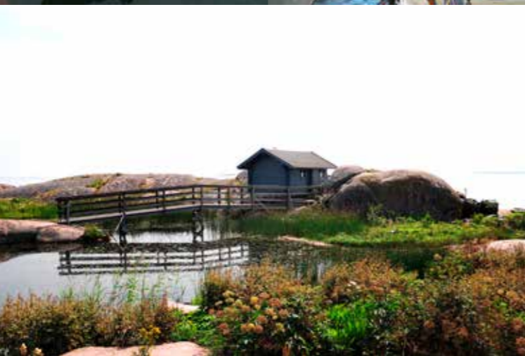
59° 49', 22° 58'

Oy Itämeren Portti-Östersjö Port Ab • Smultrongrund, 10900 Hanko, Finland tel: +358 400 544 164 e-mail: info@itamerenportti.fi • www.itamerenportti.fi